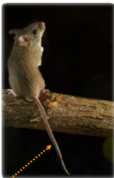
Queue glabre et annelée gris clair (7 à 10 cm)