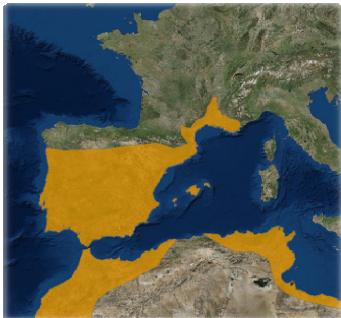
Répartition de la Souris à queue courte en Europe

A ce jour, on ne peut que constater une dynamique positive de l'espèce en Nouvelle Aquitaine. L'espèce remonte la vallée de la Garonne, et ce phénomène est probablement en lien avec l'évolution du climat et la présence d'habitats qui lui sont favorables. Méditerranéenne, la Souris à queue courte profiterait donc de l'augmentation des températures et pourrait voir la répartition de son espèce s'étendre vers le nord du territoire français.